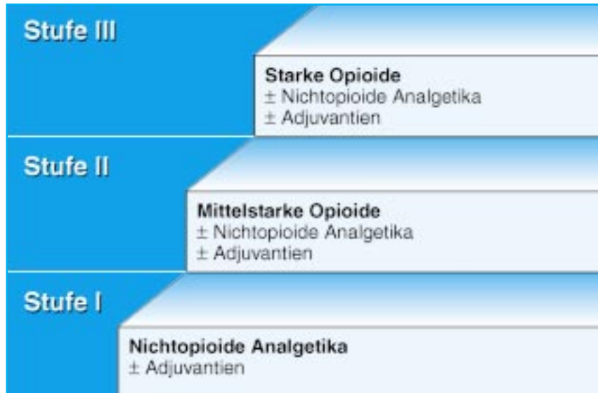
Abb. 2: 3-Stufen-Schema der WHO zur medikamentösen Tumorschmerztherapie (modifiziert nach WHO [1986, 1990]).

zen“ ein nicht nur in Entwicklungsländern sondern auch in den Industrienationen oftmals vernachlässigtes Problem darstellen [WHO 1984]. Daraufhin wurde die Kampagne „Freedom from Cancer Pain“ initiiert, in deren Rahmen 1986 von der WHO die Broschüre „Cancer Pain Relief“ veröffentlicht wurde [WHO 1986]. In dieser Anleitung wurde erstmals ein umfassendes 3-Stufen-Schema empfohlen, das unabhängig von der Tumor- und Schmerzart, einzig orientiert an der Schmerzintensität , eine suffiziente analgetische Therapie gewährleisten sollte. Dabei lag das Primat der Behandlung von Schmerzen bei Krebspatienten eindeutig auf Seiten der analgetischen Pharmakotherapie.